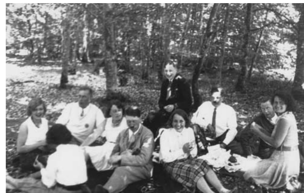
»Hitler war ja von Natur aus ein brauner Typ«: Picknick mit Henriette von Schirach (links) und Geli Raubal (rechts von Hitler)

Er dachte gar nicht daran zu gehen. Er drängte sich an mich und fragte: »Willst du Herrn Hitler nicht einen Kuss geben?« Flüchtig streichelte ich ihm das Gesicht, drückte ihm ein Abschieds-Bussi auf seine Wange. Zornig sagte er: »Einen richtigen Kuss meine ich.«